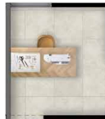
Taller de costura